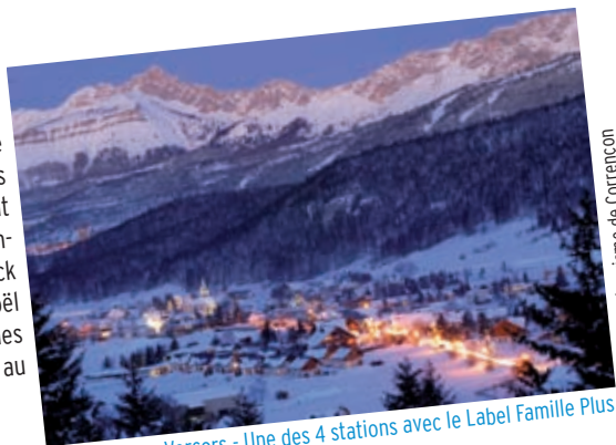
Corrençon en Vercors - Une des 4 stations avec le Label Famille Plus

L'Alpe d'Huez fait une offre pour une famille de quatre personnes pendant la semaine de Noël. À vous l'appartement (530 €), les 2 forfaits adultes (426 €), les 2 forfaits initiations enfants (170 €) et les 2 cours ski enfants (285 €) soit un total de 1407 €. Des animations ont lieu toute la semaine: atelier créatif autour des décorations de Noël, soirée Lol pour les ados, spectacle jeune public « Mais où est passé le père Noël? », spectacle sur glace, concours de sculptures sur neige, spectacle de feu, feu d'artifice et descente aux flambeaux. Le père Noël sera à la patinoire le 25 décembre. www.alpehuez.com