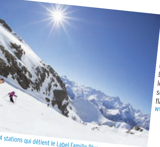
4 stations qui détiennent le Label Famille Plus

L'Alpe d'Huez fait une offre pour une famille de quatre personnes pendant la semaine de Noël. À vous l'appartement (530 €), les 2 forfaits adultes (426 €), les 2 forfaits initiations enfants (170 €) et les 2 cours ski enfants (285 €) soit un total de 1407 €. Des animations ont lieu toute la semaine: atelier créatif autour des décorations de Noël, soirée Lol pour les ados, spectacle jeune public « Mais où est passé le père Noël? », spectacle sur glace, concours de sculptures sur neige, spectacle de feu, feu d'artifice et descente aux flambeaux. Le père Noël sera à la patinoire le 25 décembre. www.alpehuez.com