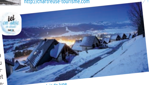
Lans-en-Vercors au clair de lune