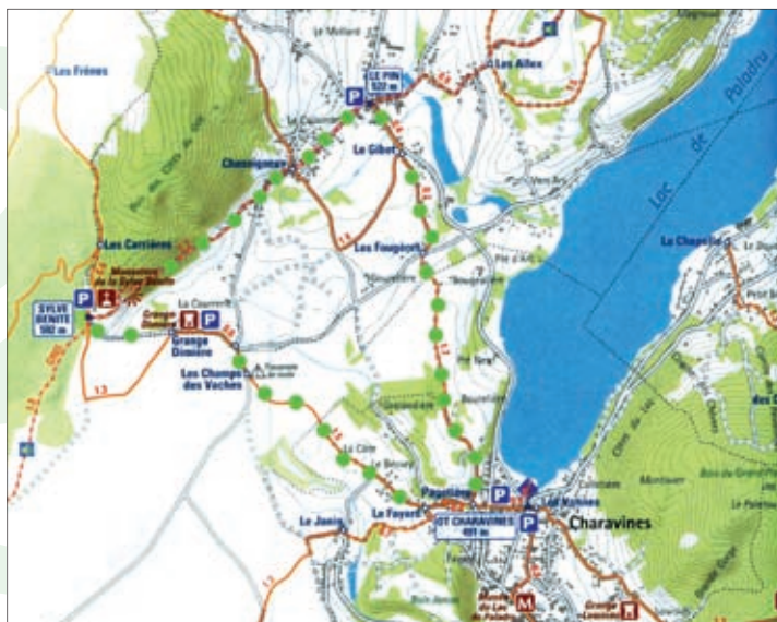
© Mोगoma et pays voironnais Échelle : 1/30 000

Durée : 3h Distance : 11 km Dénivelé : 110 m Balisage : jaune, rouge et blanc sur le circuit du GR 65 À partir de 5/6 ans La balade peut se faire en UTT