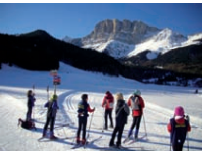
Ski de fond à Gresse-en-Vercors : vue grandiose sur le Grand Veymont

Au Col de Porte, possibilité de partir en randonnée nordique accompagnée par un moniteur de l'ESF : découverte de paysages inédits et sauvages garantis avec d'excellents connaisseurs de la montagne. Étienne Rollin : 06 50 70 17 58.