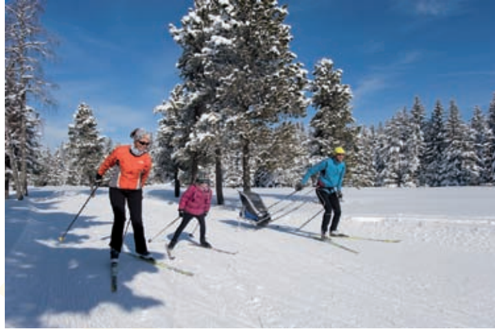
Un sport qui se pratique facilement en famille. Ici à Villard-de-Lans

Plus discret que son cousin le ski alpin, le ski de fond apporte aux enfants, dès 4 ans, des notions de glisse et d'équilibre. Son atout: il se pratique dans un milieu naturel resté intact et permet donc de profiter de nos superbes montagnes. Assez répartis sur le territoire, les domaines nordiques sont cependant sensibles à l'enneigement. Avant de partir, vérifiez bien que la neige est au rendez-vous.