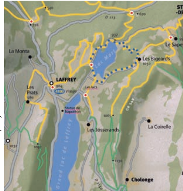
Échelle : 1:50 000 © Sipavag