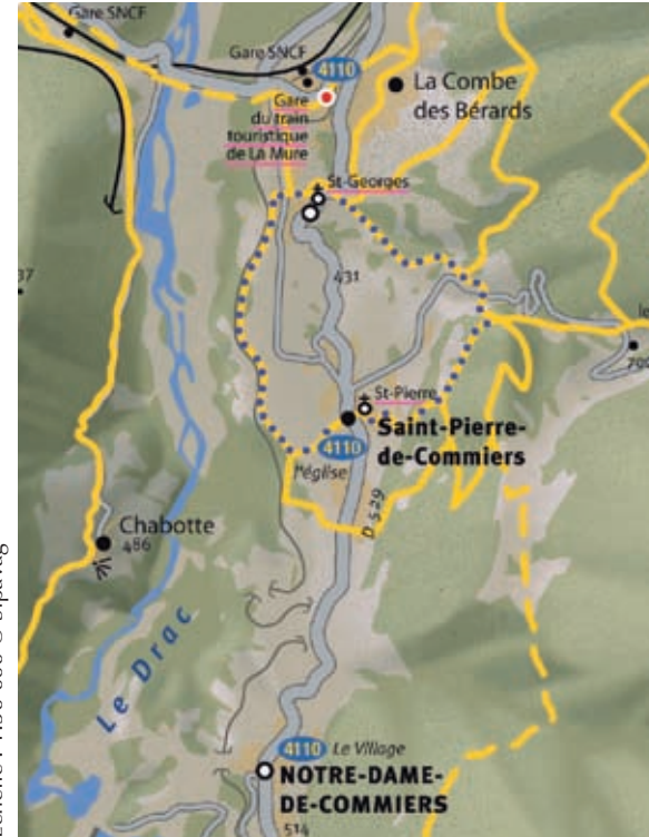
Echelle : 1:50 000

La basse-vallée du Drac comprend 4 barrages majeurs qui ont profondément modifié le paysage : Notre-Dame de Commiers, Monteynard-Avignonet, Saint-Pierre-Cognet et Le Sautet. La partie du Drac entre Saint-Georges et Notre-Dame-de-Commiers est appelée la vallée des îles. C'est un site d'escalage migratoire très important pour les oiseaux. Présence du castor d'Europe.