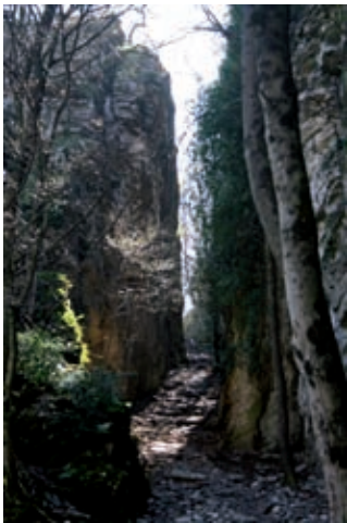
Le coup du sabre

Le départ se situe à environ vingt minutes de l'arrêt de La Poya (ligne A). Vous pénétrez dans une rue calme qui longe un petit ruisseau. Une petite porte permet d'accéder au parc de La Poya (ouvert tous les jours de 9h à 21h jusqu'au 30 septembre). Au fond du parc, le château de la Rochette qui date de la fin du XV e siècle. Poursuivez la balade. Vous arrivez à proximité du vieux village de la Poya. Prenez la rue de La Poya qui traverse le village. La montée, assez prononcée à son début, vous permet d'accéder au lieu-dit Le coup du sabre , sorte de