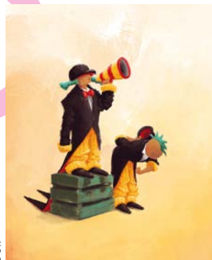
Une première édition pour les juniors